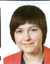
Miloslava Vostrá, poslankyně za KSČM