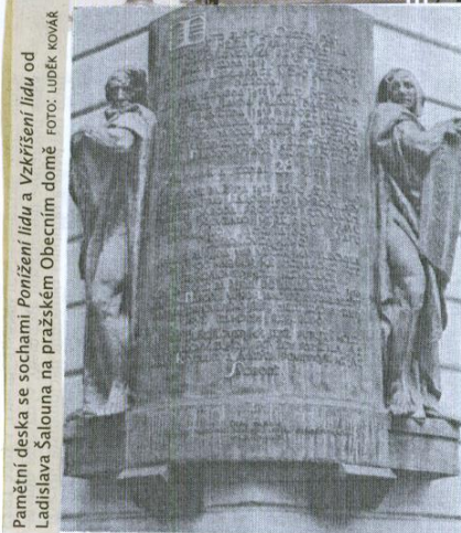
Pamětní deska se sochami Ponižení lidu a Vzkříšení lidu od Ladislava Šalouna na pražském Obecním domě.