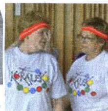
MDŽ v Kladně