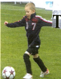
Zelená je tráva, fotbal, to je hra...