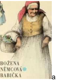
BOŽENA NĚMCOVÁ BABIČKA

S vlasteneckým prostředím se setkává až v Polné, hltá české knihy a začíná působit i na ostatní manželky měšťanů. Vše dovršila konečně Praha, kde zářila ve společnosti českých spisovatelů. Píše své první básně, roku 1843 vychází v Květech báseň „Ženy české.“ Český svět měl poprvé ženu – básničku a pak i spisovatelku. Zaujal ji také Komunistický manifest. V roce 1855 s podporou 250 zlatých od hraběte Kolowrata odjela na Slovensko, kde se léčila a horlivě sbírala báje a pohádky a přetvářela je tak, jak je známe z dětských knížek. Její povídky a hlavně stěžejní dílo Babička byly velmi populární, takže Litomyšlský nakladatel Augusta sepisuje s Němcovou v roce 1861 smlouvu na vydávání jejich minulých i budoucích knih. Jenže Němcová už nestihala psát - spolu s nemocí přišla tvůrčí krize, autorka neplnila smlouvu. Augusta se zlobil, Němcová sama dlužila v hostinci za byt stravu. Manžel si v listopadu pro ni přijel, uhradil dluhy a odvezl do Prahy. Přes veškerou péči českých vlasteneckých lékařů brzy, 21.1.1862 umírá.