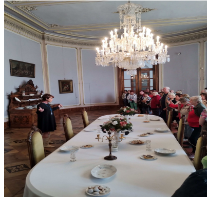
Jak se říká, užili jsme si dne.