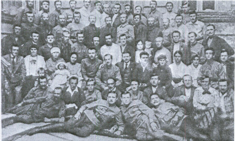
Antonín Zápotocký mezi ř. rudoarmějci při své návštěvě Sovětského Ruska v r. 1920.

Po vzniku samostatné republiky byl významný 1.máj 1920, kdy kladenská pracující, zklamání vývojem v nové republice, složili slavnostní Přísahu věrnosti ruské revoluci a III.internacionále . Jejho historického II.kongresu v létě 1920 v Moskvě, se zúčastnil též Antonín Zápotocký. Tam byly vytyčeny úkoly – cesta k diktatuře proletariátu a vytváření jednotných komunistických stran v jednotlivých zemích. Tehdy se A.Zápotocký osobně setkal s V.I.Leninem, který se velmi zajímal o Rudé Kladno. A.Zápotocký se tehdy v bolševickém Rusku setkal i se členy Československé komunistické strany na Rusi.