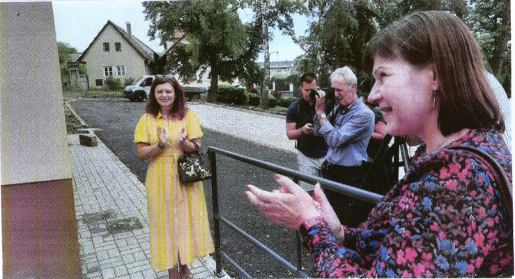
V půli srpna se jsem účastnila slavnostního otevření přístavby Základní školy v obci Hudlice za účasti mnoha významných hostů - hejtmanky Středočeského kraje, starostů okolních obcí a dalších lidí. Největší radost budou mít určité děti a rodiče. Škola je připravena přivítat je v novém školním roce. Takovému úroky, které obcím a lidem pomáhají, budu i nadále podporovat. Ing. Bc. Miloslava Vostrá, poslankyně a kandidátka do Senátu Parlamentu ČR pro volební obvod č. 30 - Kladno

Jde samozřejmě o spekulaci a aroganci. Tak to zdaleka není. Proč tito pánové a jejich politické strany nepoužívali slova o předvolební korupci, když před několika měsíci rozhodovali o řadě projektů v koronavirové krizi. Ať už Anticovid I, II, III, ať už půjký podnikatelům, prominuté splátky pojistného, sociální a zdravotní pojištění a tak dále. To samozřejmě vládě, která svým rozhodnutím přispívá z peněz daňových poplatníků v řádech stovek miliard korun, budou vyčítat? Když má malá částka 14,5 miliardy putovat seniorské populaci? Že se nestydíte!