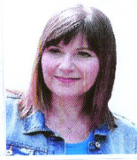
Kandidátka do Senátu VO č.30