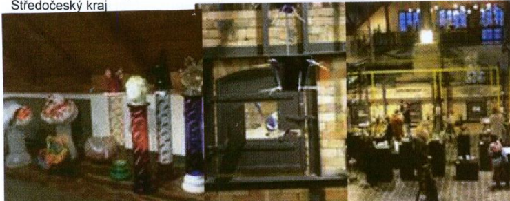
PS. Do Sklářny František a do Sázavského kláštera chystá zájezd Diaklub Kladno na 23. května 2018