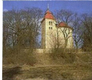
Jedenáct století starý kostel sv. Petra a Pavla je v Kladně nejstarší stojící budovou v Česku. Od roku 1958 je chráněn jako kulturní památka ČR.