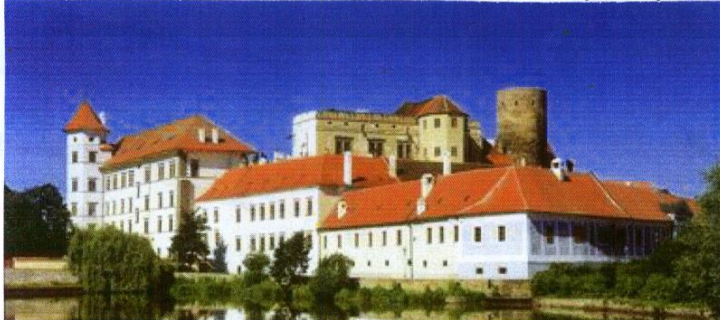
Pak jsme absolvovali prohlídku hradu s původními interiéry, Královským sálem i kaplí.

Prohlídku jsme začali Černou kuchyní. Velice zajímavé bylo její vybavení, včetně potravin i ryb a zvířiny. Jen začít vařit... Nám by stačilo jen zatopit.